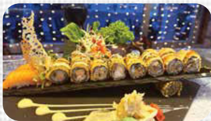
Fast Charge C,D €19.9

8st. Sake Maki 8st. Tekka Maki 8st. Avocado Maki