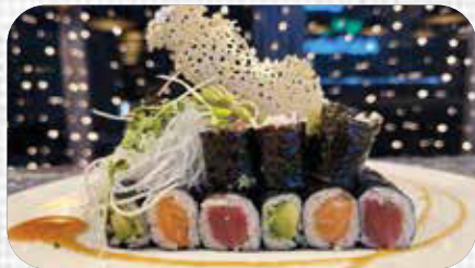
Makimagazine C € 14.9

8st. Sake Maki 2st. Sake Nigiri 3st. Biolachs Sashimi