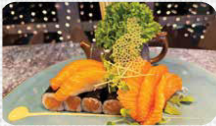
♥ Sake C € 15.9

8st. Sake Maki 2st. Sake Nigiri 3st. Biolachs Sashimi