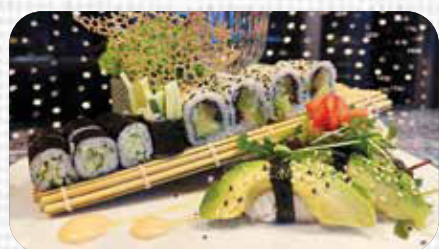
Green Energy €17.9

8st. Sasuke Mini Crunchy 8st. Naruto Mini Crunchy 2st. Sake Nigiri