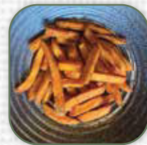
Süßkartoffel Pommes €3.0