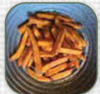
Süßkartoffel Pommes €3.0